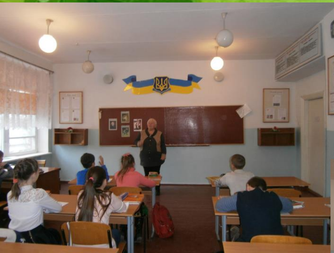
Фото з уроків