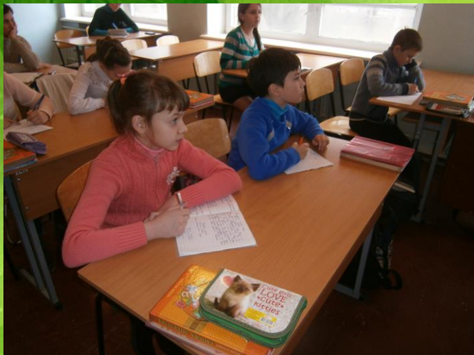
Фото з уроків